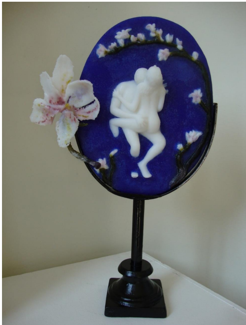
Danny De Mol, 'Overgave - Surrender'

Afmetingen: H 300 mm x B 220 mm x D 15 mm