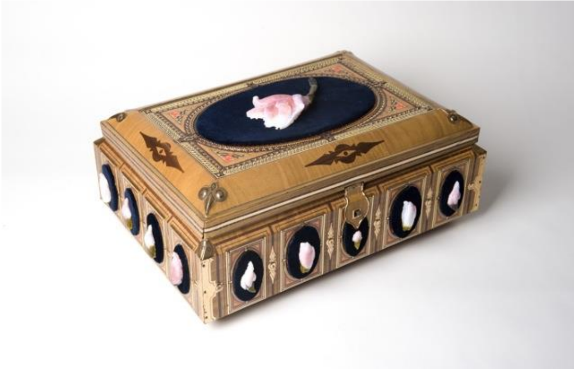
Danny De Mol, 'Tresaured' gesloten/ fermé