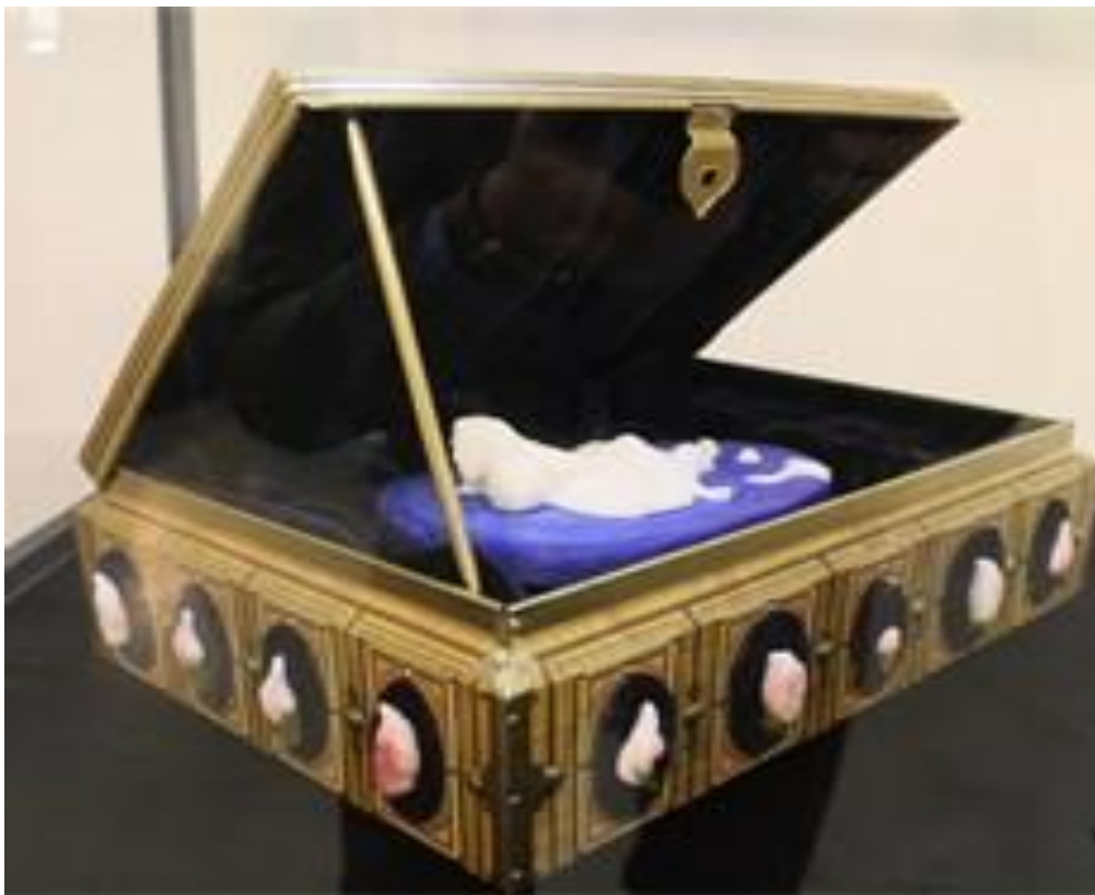
Danny De Mol, 'Tresaured' open/ouvert (foto D. De Mol)

Afmetingen: H 340 mm x B 440 mm x D 320 mm