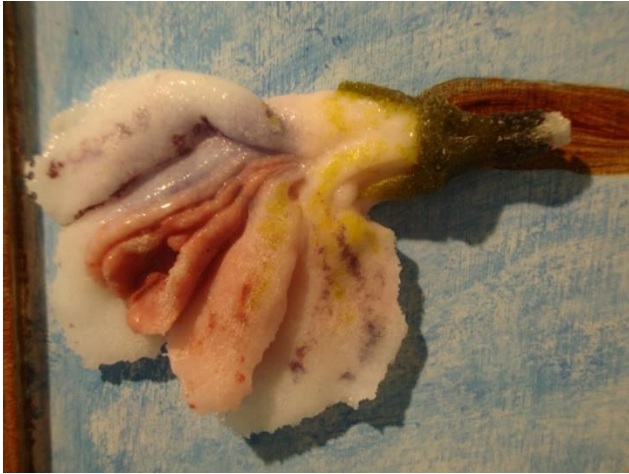
Danny De Mol, 'Tuin der Liefde' detail vrouwelijke liefde