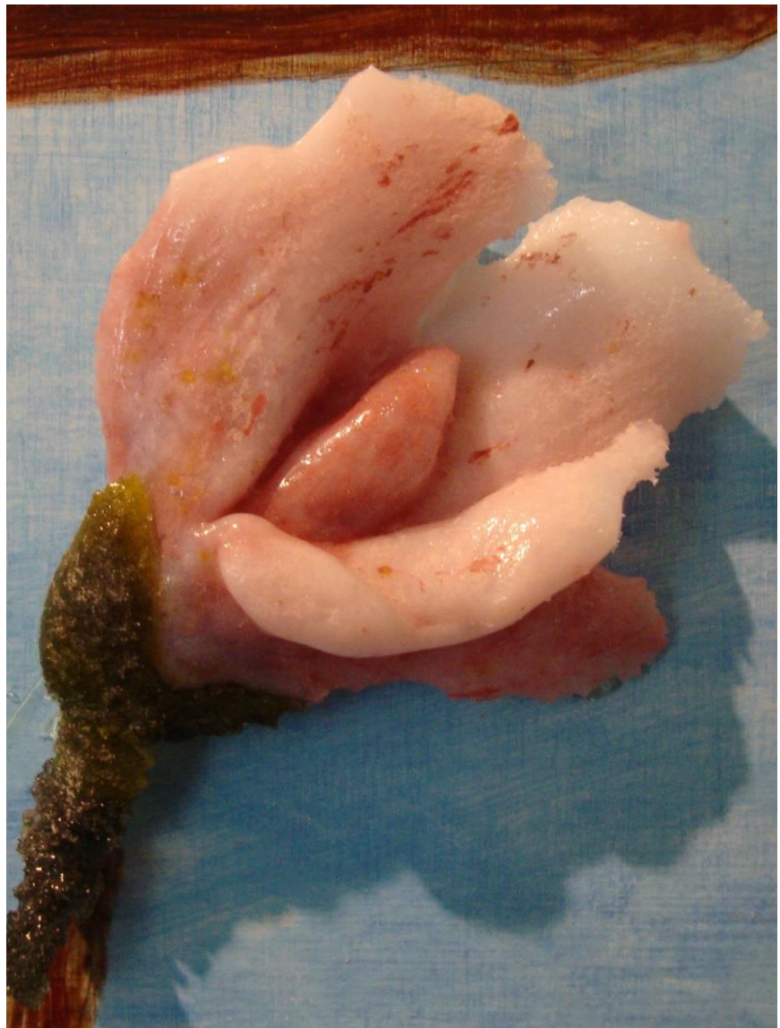
Danny De Mol, 'Tuin der Liefde' detail mannelijke liefde