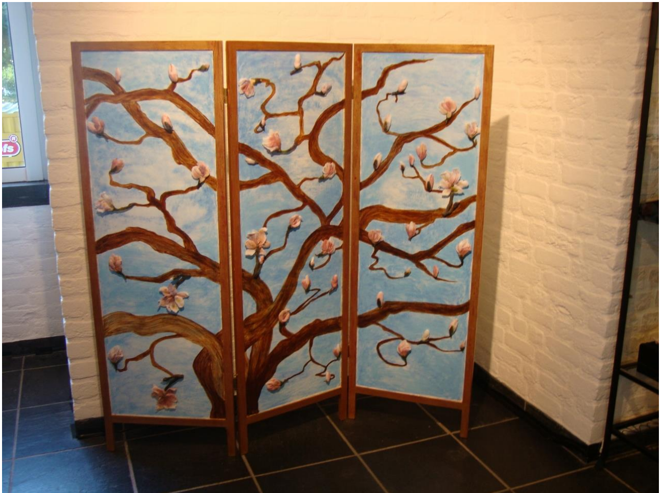
Danny De Mol, 'Tuin der Liefde'

Afmetingen: H 1320 mm x B 1680 x D 50 mm